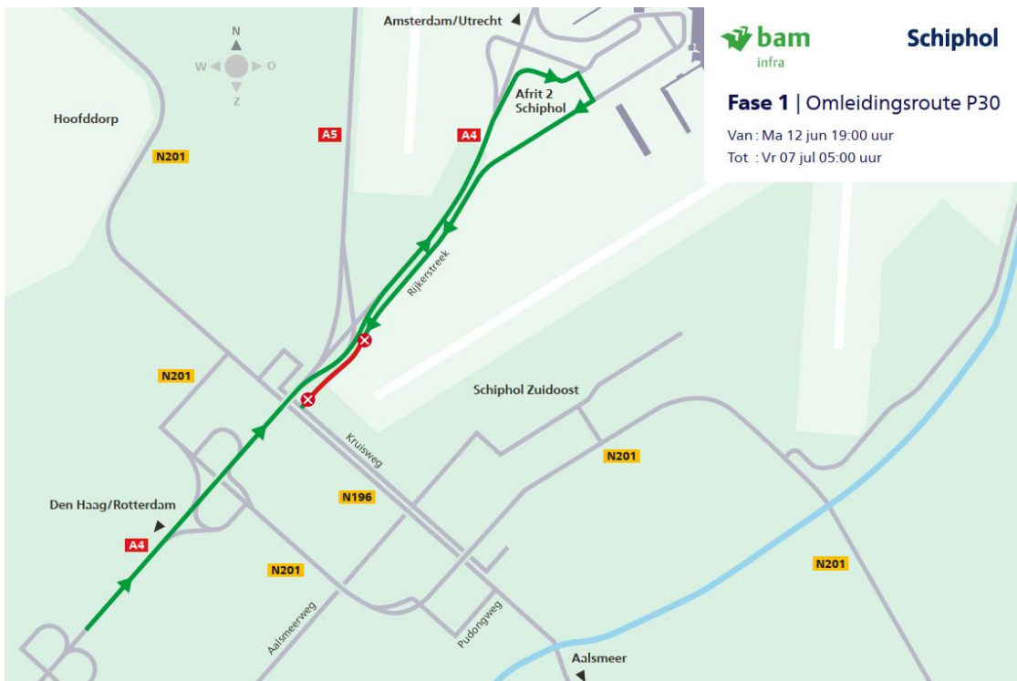
Figuur 2: Adviesroute omleiding P30

Toegang tot het parkeerterrein van P30 is overdag mogelijk en vanaf 19.00 uur tot 05.00 uur via de Westelijke Randweg/Rijksterreek en verloopt via de huidige inrit.