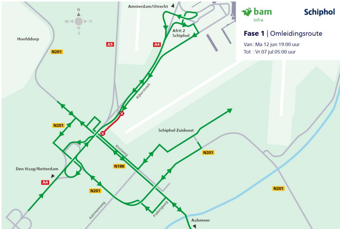
Figuur 1. Adviesroute omgeleid verkeer